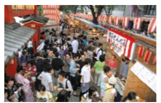
門前屋台コーナー

おまつりといえば、飲食の屋台も大きな楽しみのひとつ。毘沙門天門前にはズラリと屋台が並びます。近隣飲食店や専門店の出張販売屋台ですので、どれも神楽坂評判の味ばかり！ 休憩所も設置されますので、ひと休みにどうぞ。