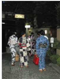
ゆかたでコンシェルジュ・ゆかた着付けサービス

神楽坂はゆかたが似合う街。その魅力を十分に味わえるイベントが「ゆかたでコンシェルジュ」です。NPO法人「粋なまちづくり倶楽部」による神楽坂のガイドツアーで、ゆかた姿の案内人の解説を聞きながら、路地や見どころを巡ります。所用時間は1回30～40分前後。人数が集まり次第、随時出発します。また、ゆかたで参加の方には、記念写真をプレゼントします。