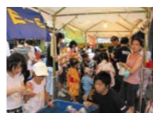
毘沙門天 子供縁日

毘沙門天 子供縁日 今夜は童心に戻って、毘沙門天境内に設けられた商店会直営のお楽しみ夜店広場で遊びましょう。金魚すくい、輪投げ、スーパーボールすくい、ヨーヨー釣りなど楽しい縁日遊びが登場します！ また、各商店店先ではワゴンセールも開催されます(実施時間は各店の営業時間中となります)。