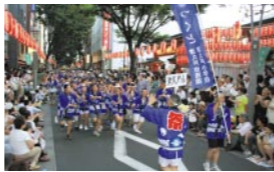
子供阿波踊り大会